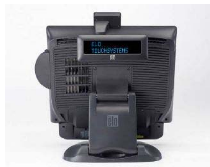
Versione Standard Compatta